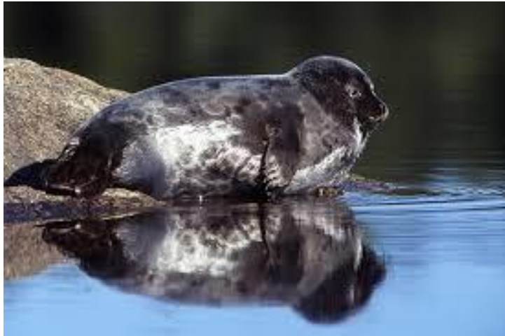
Saimaannorppia arviolta 380 yksilöä

Yrittäjyyden vire, kasvu ja kannustus 22.11.2018 Pieksämäki